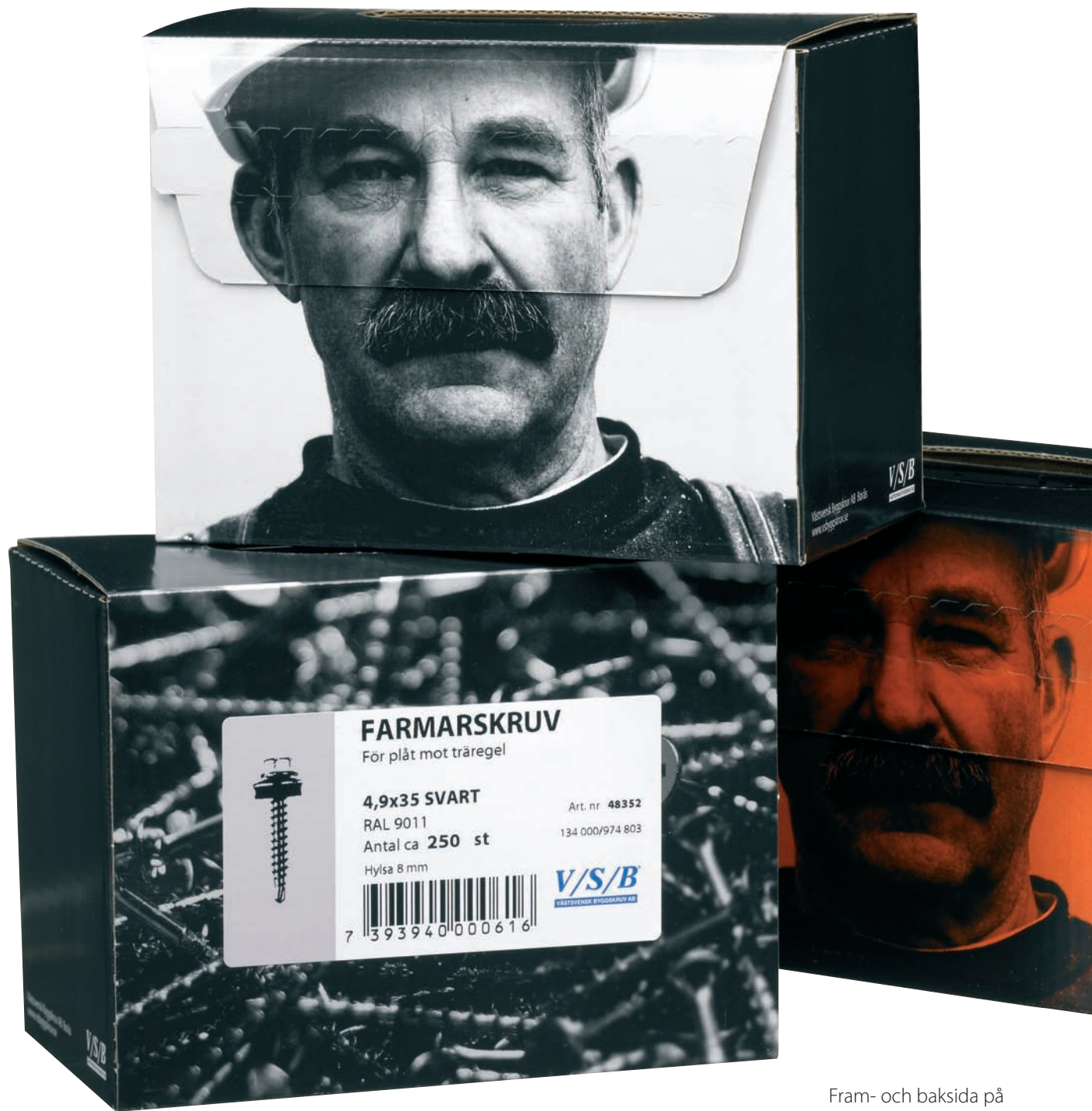
Fram- och baksida på nya förpackningen.